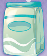
Sucre en poudre