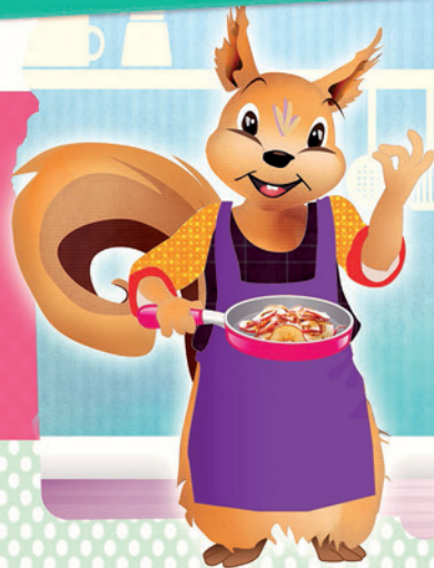
pelure de pomme de terre

Aide Gustave à retrouver les plats correspondant aux épluchures.